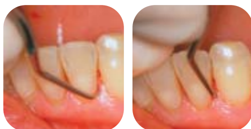
Scaling sottogengivale e levigatura radicolare con la nuova Micro Mini Curette